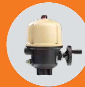
AQ5 - AQ10 - AQ15 - AQ25 - AQ30 - AQ50 - AQ80 - AQ100 AQ150 - AQ280 - AQ430 - AQ610 - AQ830 - AQ1000 version SWITCH

pour les servomoteurs électriques quart de tour