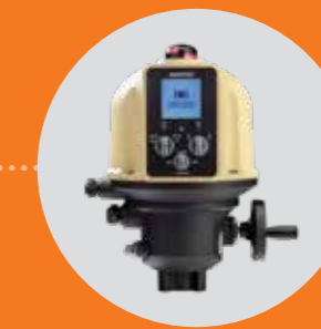
AQ5 - AQ10 - AQ15 - AQ25 - AQ30 - AQ50 - AQ80 - AQ100 AQ150 - AQ280 - AQ430 - AQ610 - AQ830 - AQ1000 version LOGIC