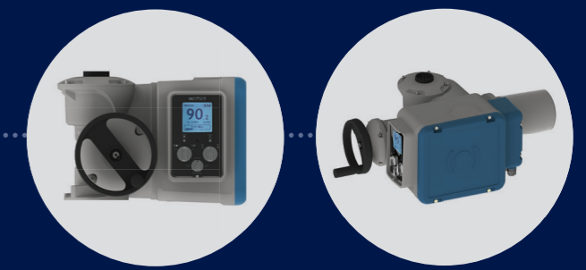
BT3 - BT6L - BT6 - BT14 - BT25 - BT50 version INTELLI+®