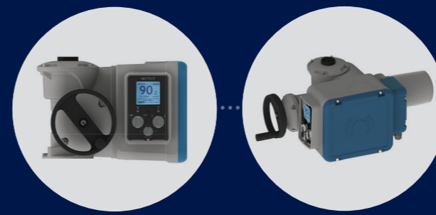
BT3 - BT6L - BT6 - BT14 - BT25 - BT50 version LOGIC